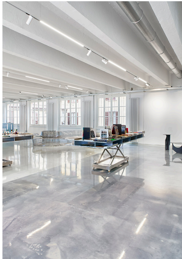
A.24 + Vector 55 - Carlotta de Bevilacqua