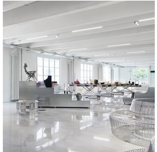
A.24 + Vector 55 - Carlotta de Bevilacqua