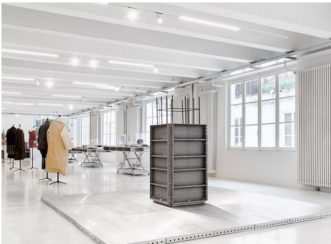
A.24 + Vector 55 - Carlotta de Bevilacqua