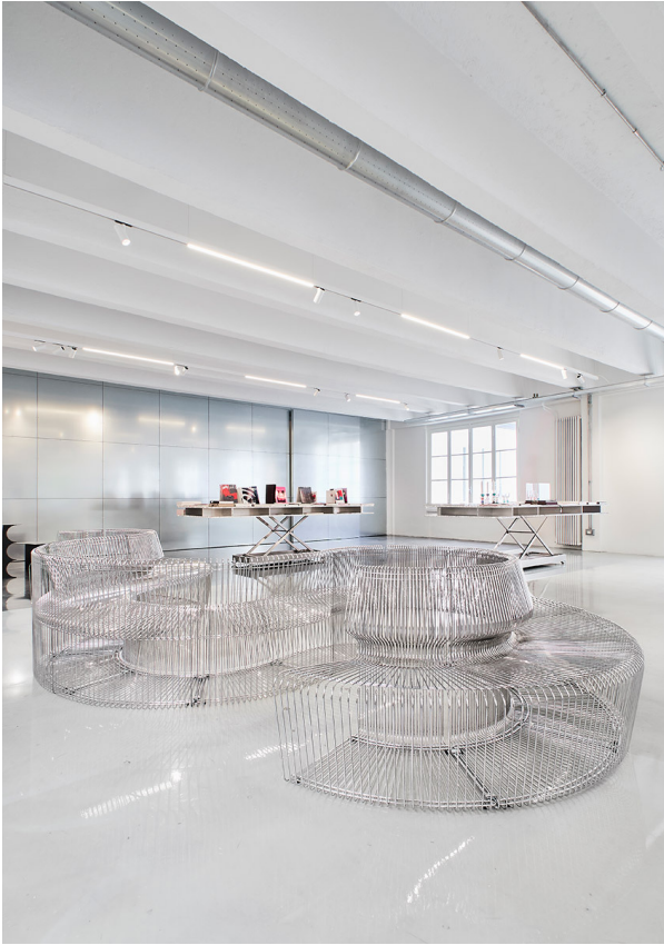
A.24 + Vector 55 - Carlotta de Bevilacqua