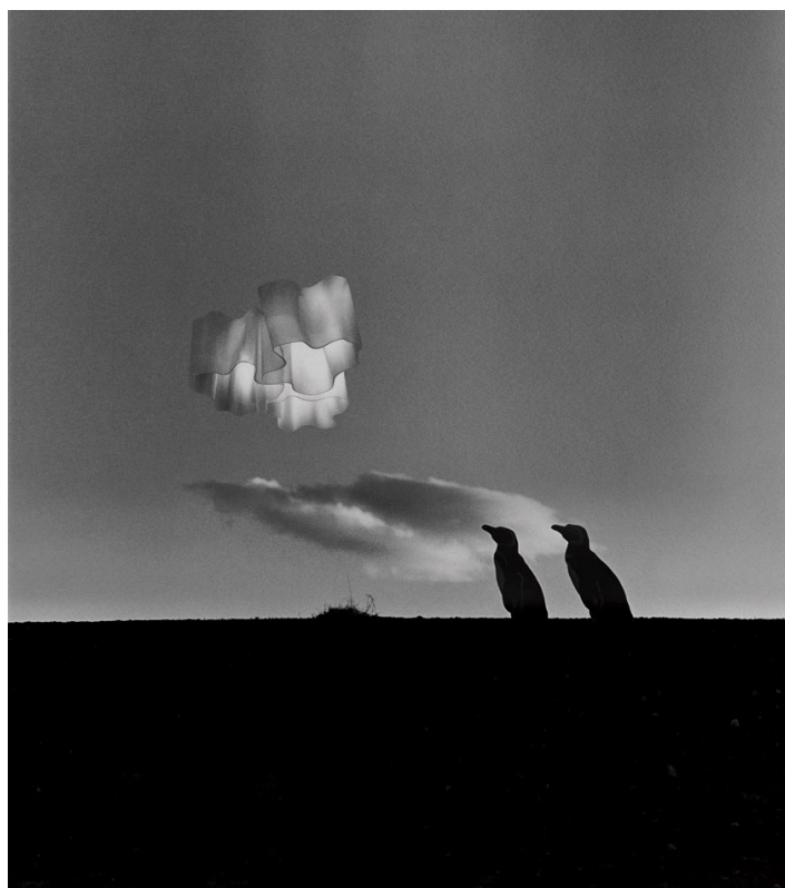
Logico, 2001

Tutta la collezione Artemide è espressione di un design responsabile e attento. È da sempre presente una spinta a sviluppare nuovi prodotti in cui l'attenzione verso l'ambiente sia intrinseca e connaturata nella volontà progettuale. Artemide si impegna in una costante attività di ricerca, nel tentativo di sviluppare sistemi di illuminazione che rappresentino un'alternativa migliore a ciò che già esiste. L'innovazione è guidata da valori e testimoniata da numerosi brevetti di invenzione che, grazie ad un transfer tecnologico estremamente ridotto, sono immediatamente applicati nei prodotti.