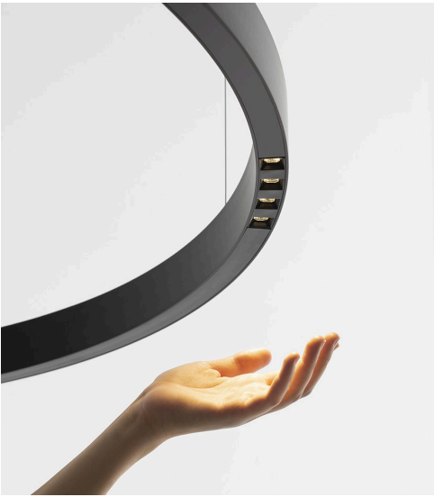
A.24 con emissione Sharp

➤ Dagli anni 90 con “The Human Light” inizia un percorso che dichiara sempre più esplicitamente un approccio al progetto guidato da valori, spinto non solo da una ricerca scientifica e da una competenza tecnologica e produttiva ma anche da un approccio umanistico ed etico.