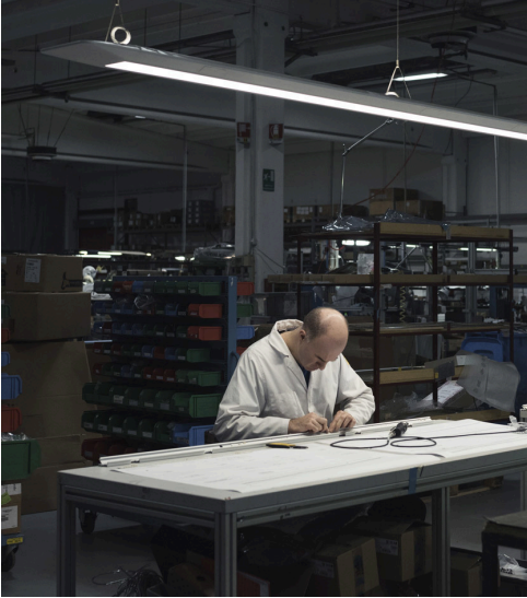
Artemide, Pregnana Milanese

➤ Il concreto impegno di Artemide verso una sostenibilità a 360°, non solo ambientale ma anche sociale, è un percorso che ha portato l'azienda ad essere certificata ISO 9001, ISO 14001 e ISO 45001.