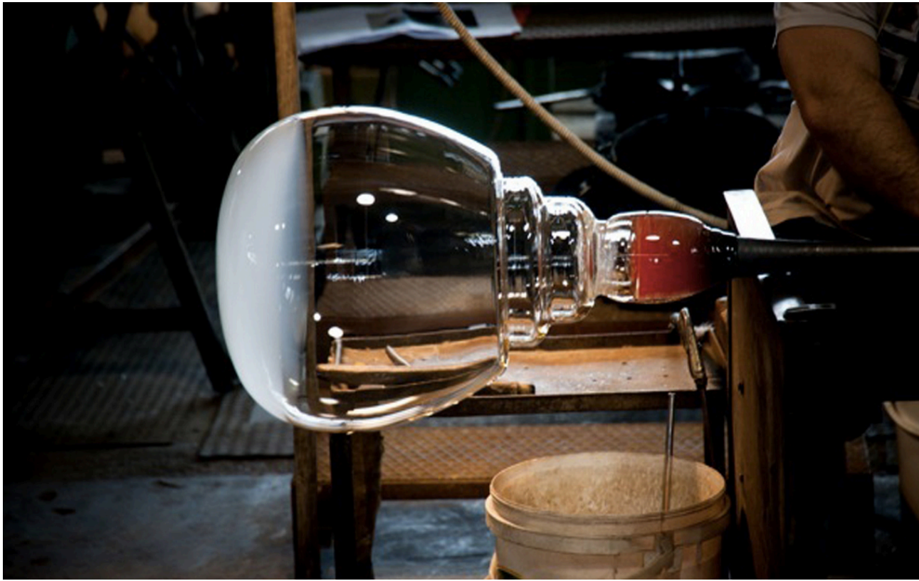
Vetrofond, Glass Workshop