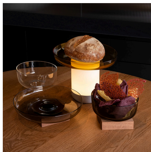
Bontà, Davide Oldani