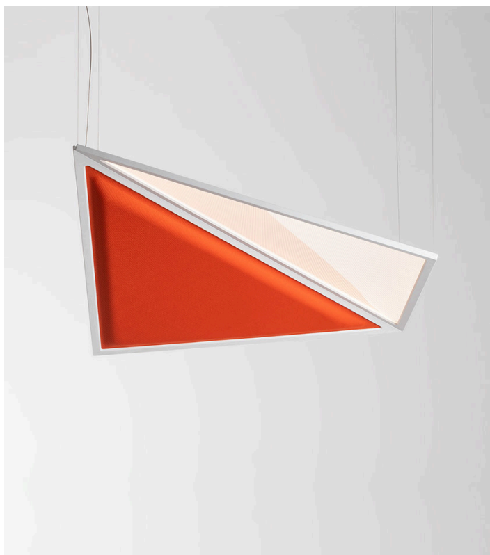
Flexia Suspension, Mario Cucinella

Flexia è composta da due ali flessibili, una è un pannello acustico che controlla il riverbero assorbendo le onde sonore riflesse nell'ambiente, l'altra è una superficie emittente trasparente che genera una luce uniforme e confortevole grazie alla tecnologia brevettata di Discovery. Si inserisce in modo trasversale in tutti i contesti nei quali occorre garantire benessere acustico e visivo.