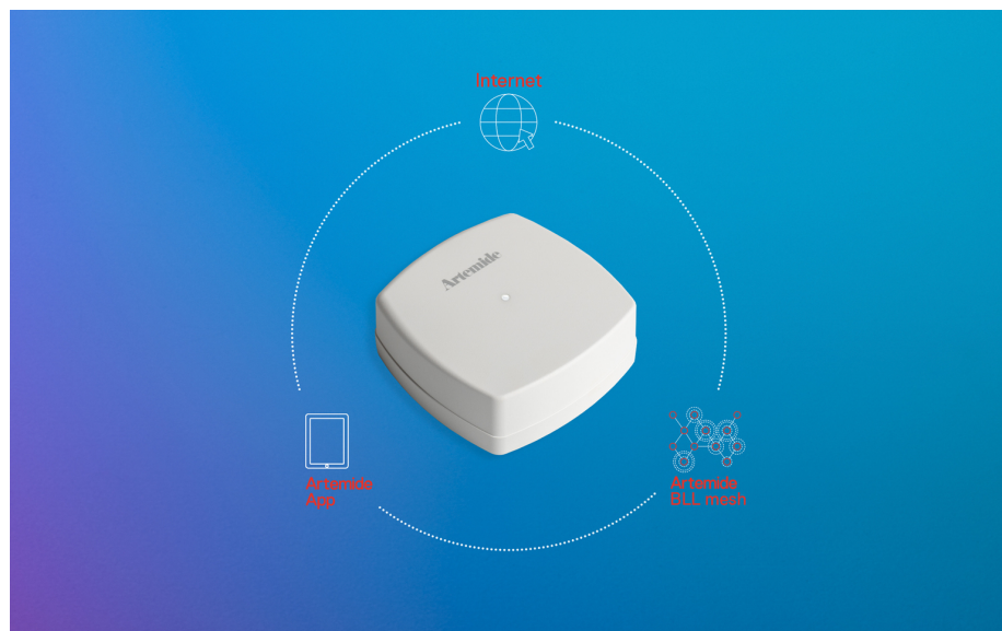
Edimetra Gateway Eco-system