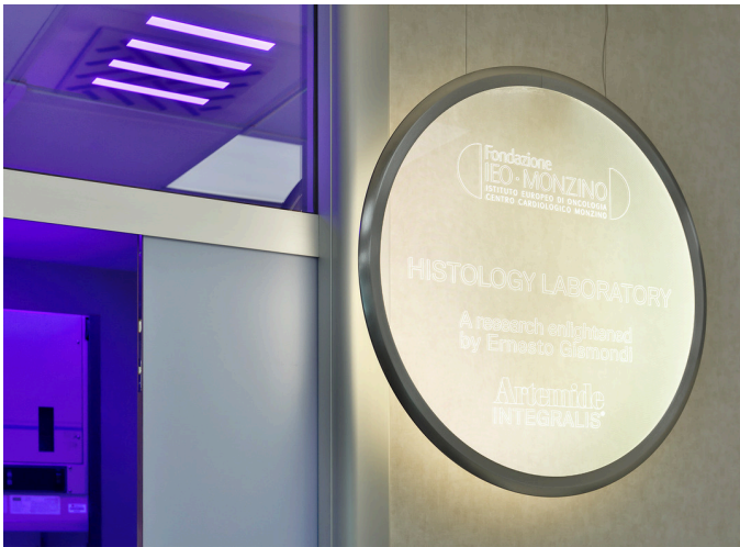
Discovery Special - Ernesto Gismondi | A.39 Diffused Pure Integralis - Carlotta de Bevilacqua

Sono stati illuminati due laboratori, quello di Microscopia e quello di Istologia, con particolare attenzione alle condizioni ambientali, attraverso la riduzione, grazie alla luce, dei microorganismi patogeni.