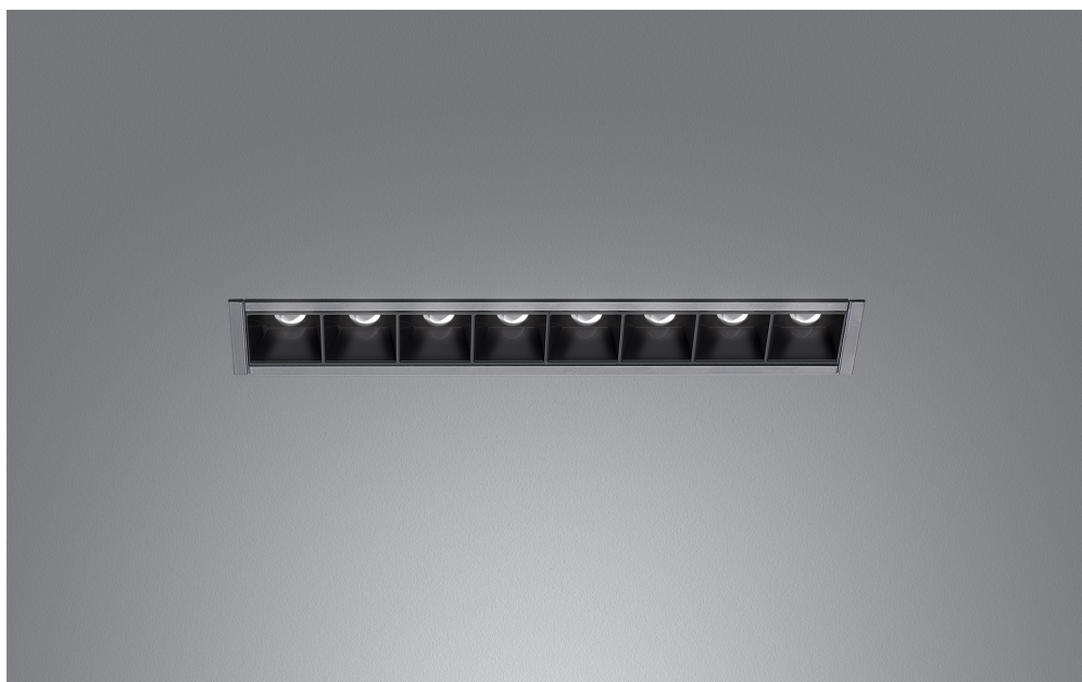
Sharp Refractive Emission - Carlotta de Bevilacqua