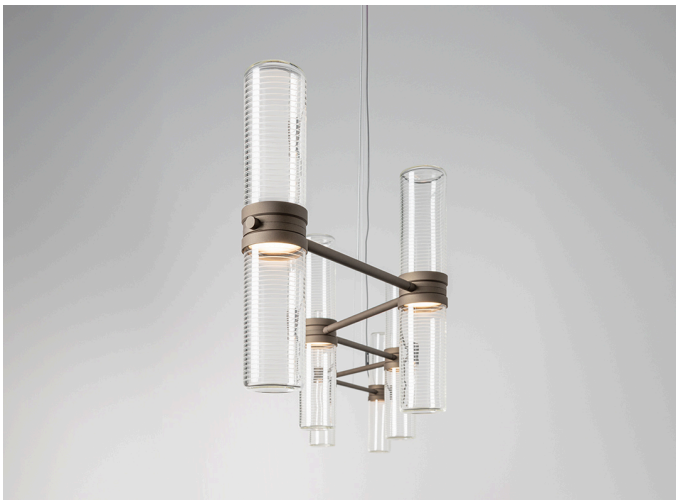
Zephyr Linear - Carlo Colombo

Siamo orgogliosi di annunciare che Zephyr , firmato da Carlo Colombo , ha ricevuto il prestigioso Archiproducts Design Awards 2024 . Questo importante riconoscimento premia un progetto che combina l'artigianalità del vetro con una tecnologia avanzata, offrendo soluzioni d'illuminazione di grande impatto estetico e funzionale. Zephyr è caratterizzato da un diffusore cilindrico in vetro soffiato a mano, lavorato con una texture ondulata che alterna strisce trasparenti e opaline. Questa raffinata tecnica non solo arricchisce esteticamente il diffusore, ma garantisce anche una diffusione della luce morbida e non abbagliante lungo l'intera superficie del cilindro, migliorando il comfort visivo.