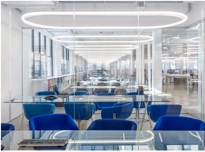
Alphabet of Light - System