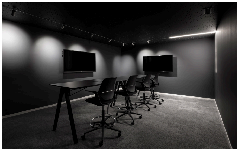
A.24 System + Vector Magnetic - Carlotta de Bevilacqua