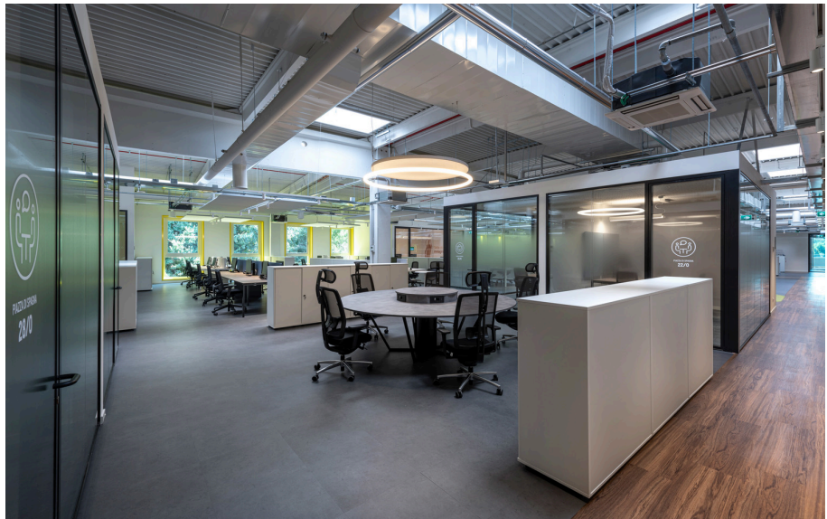
AoL Circular - Bjarke Ingels Group

La luce Artemide segue le esigenze di questa ampia varietà di spazi, combinando sistemi flessibili e riconfigurabili capaci di adeguarsi ai differenti layout e funzioni con performance dinamiche.