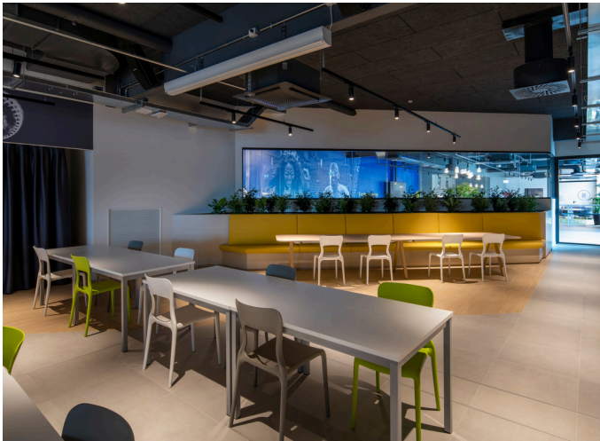
A.24 System + Vector Magnetic - Carlotta de Bevilacqua