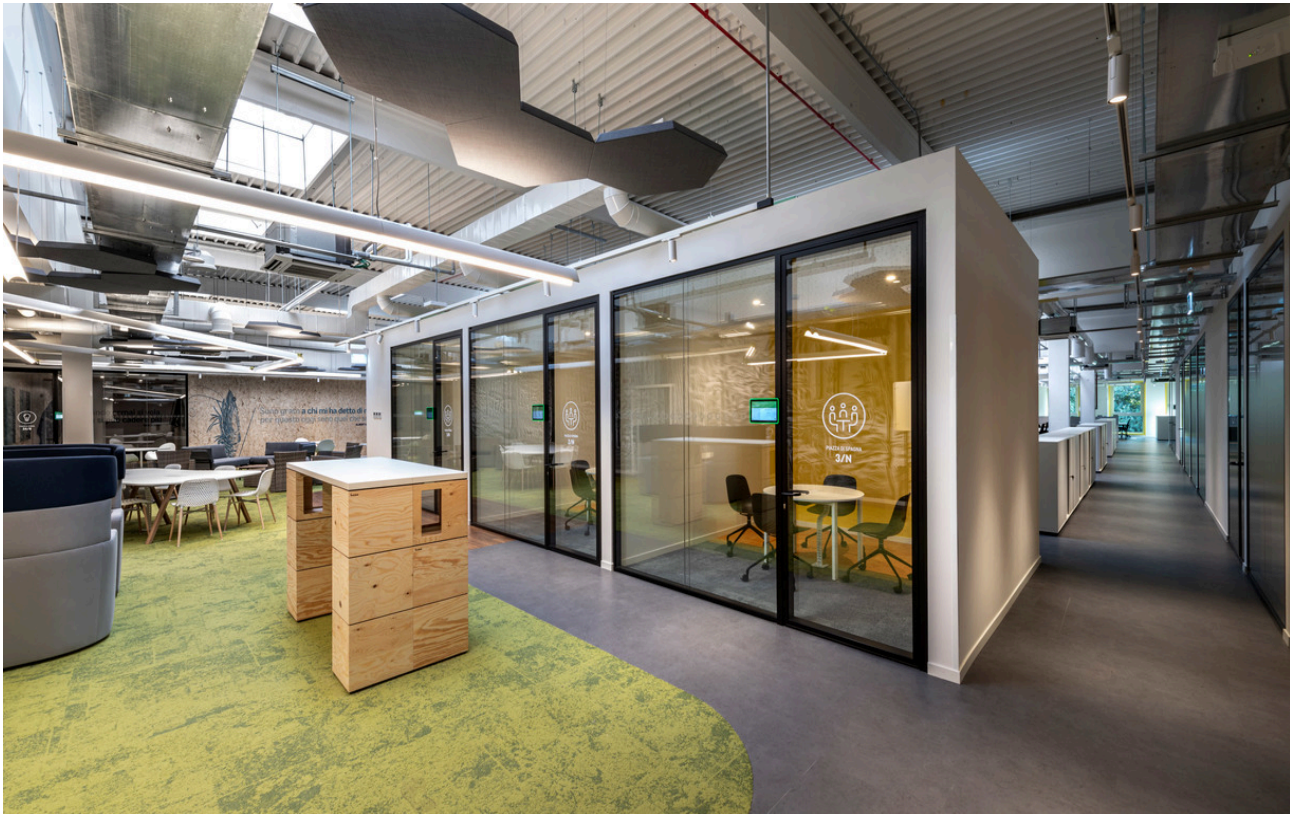
Series Y - Gensler | Vector - Carlotta de Bevilacqua