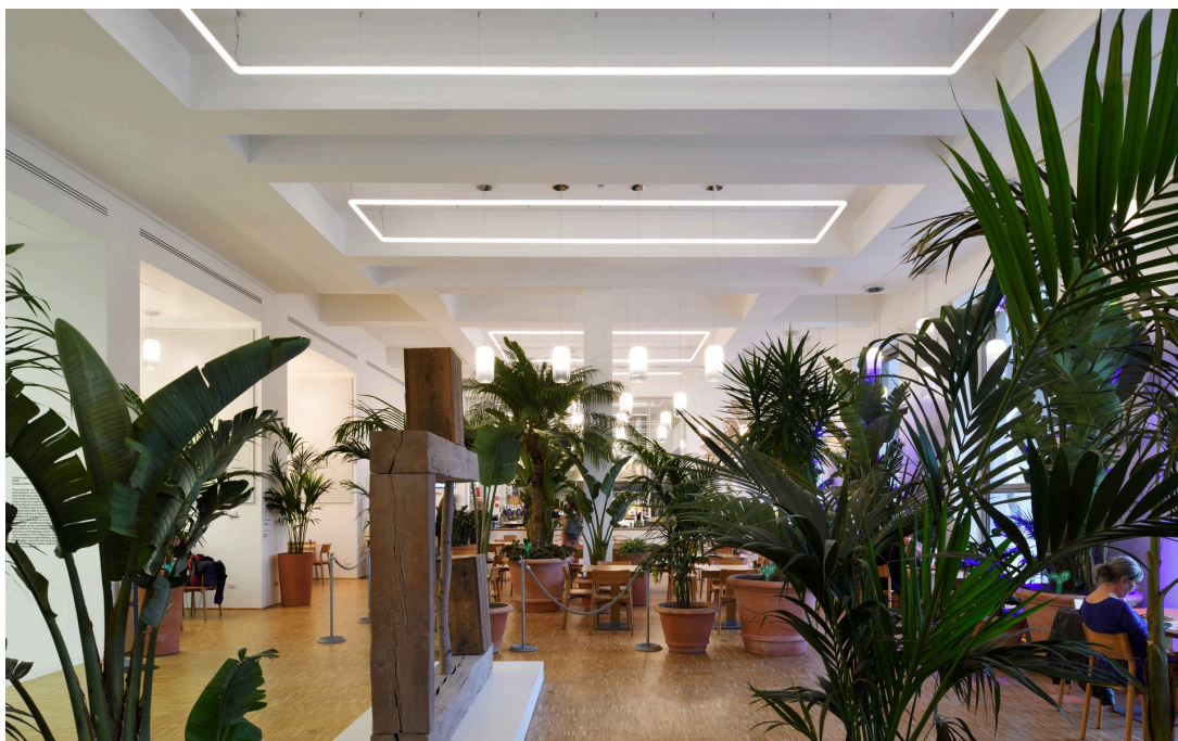
Gople - BIG | Alphabet of Light - BIG

Alphabet of Light, di BIG, sottolinea l'architettura con linee continue di luce diffusa e confortevole che l'accompagnano modulandosi su di essa grazie alla flessibilità del sistema brevettato.