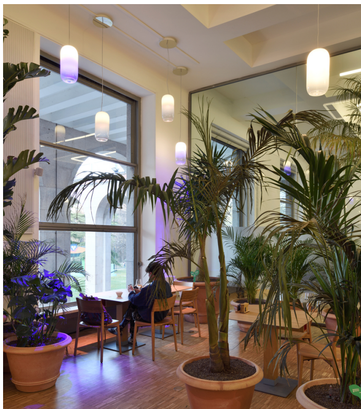
Gople & Gople RWB - BIG

Una serie di Gople, sospensioni in vetro lavorato a mano disegnate da BIG, illuminano i tavoli della caffetteria. La presenza della natura anche negli spazi interni diventa fondamentale, per questo è stata introdotta anche la versione RWB di Gople, una innovativa tecnologia capace di nutrire la natura supportandone la crescita con la giusta lunghezza d'onda.