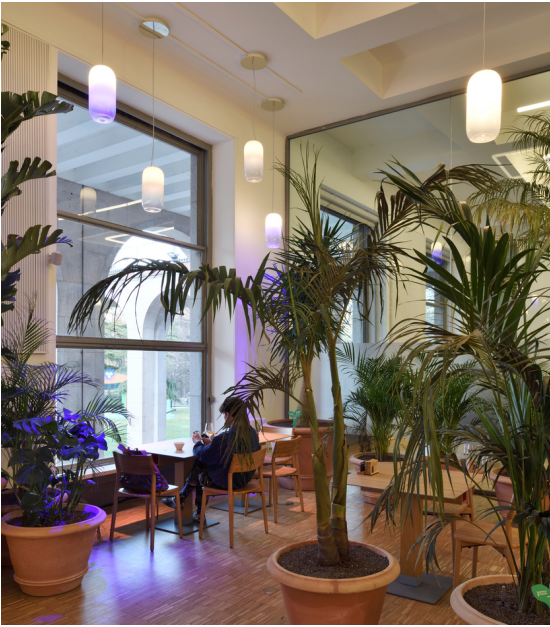
Gople & Gople RWB - BIG

Una serie di Gople, sospensioni in vetro lavorato a mano disegnate da BIG, illuminano i tavoli della caffetteria. La presenza della natura anche negli spazi interni diventa fondamentale, per questo è stata introdotta anche la versione RWB di Gople, una innovativa tecnologia capace di nutrire la natura supportandone la crescita con la giusta lunghezza d'onda.