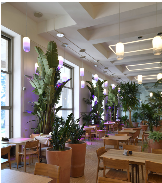
Gople - BIG

Artemide rinnova ancora una volta la sua collaborazione con Triennale Milano , prestigiosa istituzione culturale e punto di riferimento per una Milano simbolo internazionale del design.