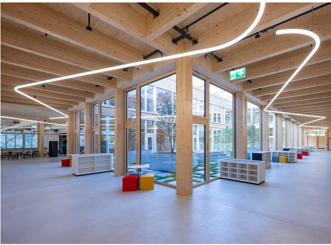
Alphabet of Light System - Bjarke Ingels Group