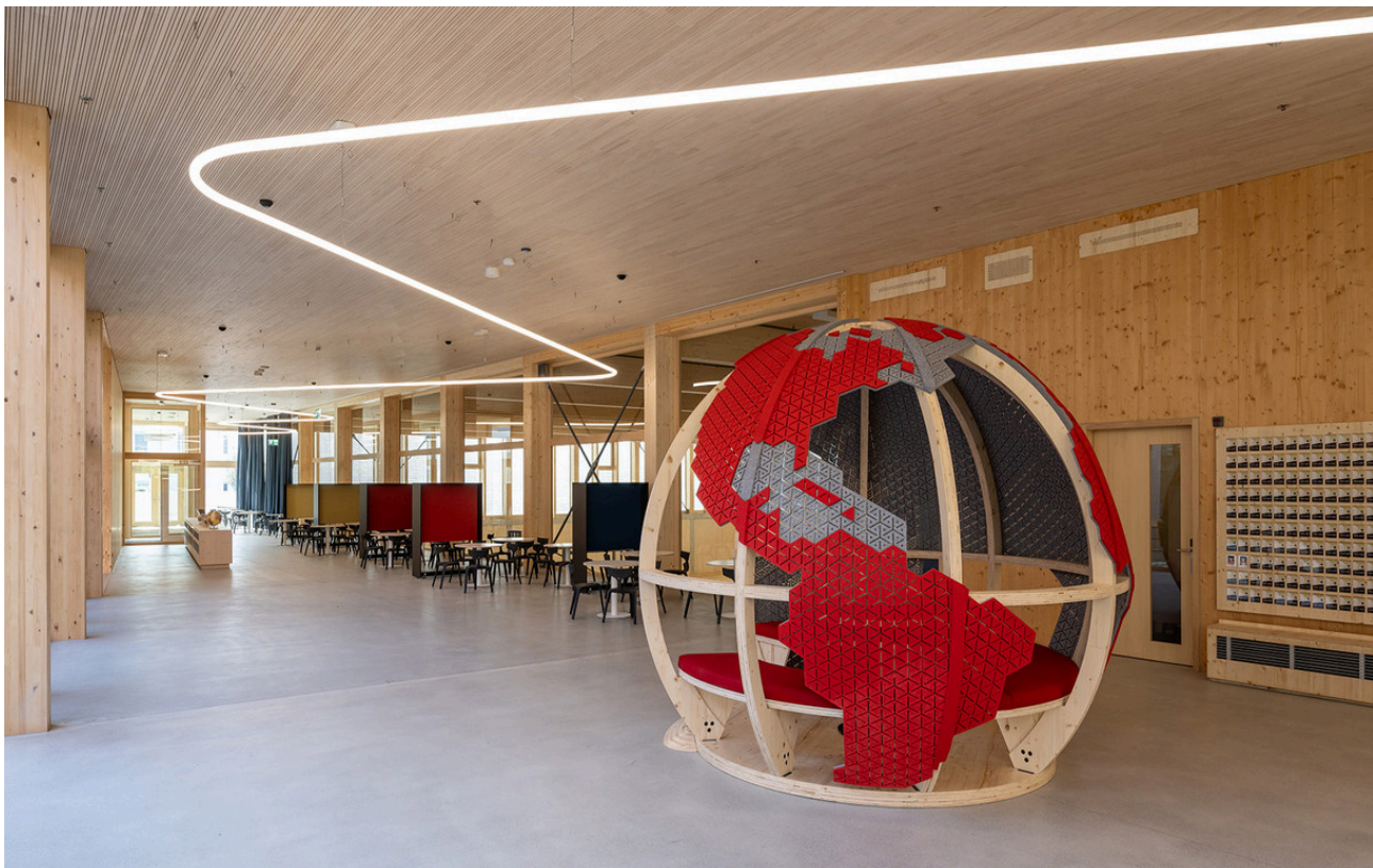
Alphabet of Light System - Bjarke Ingels Group

Alphabet of Light non solo illumina gli spazi della International School Rheintal, ma fa anche luce sulla dedizione della scuola a un futuro più verde e sostenibile.