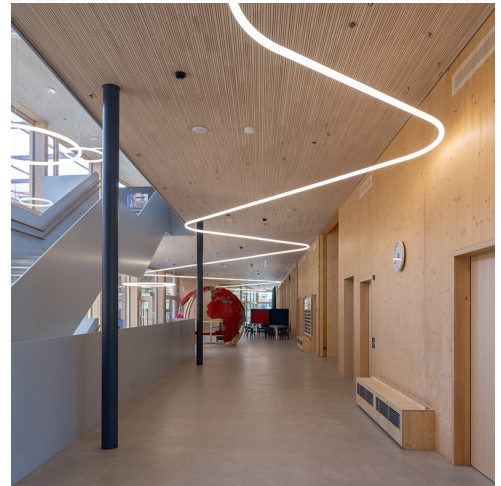
Alphabet of Light System - Bjarke Ingels Group