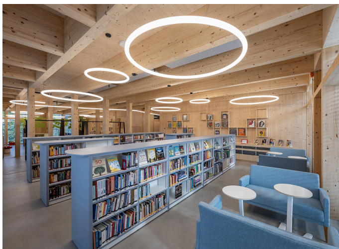
Alphabet of Light Circular - Bjarke Ingels Group