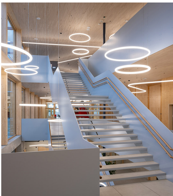
Alphabet of Light - Bjarke Ingels Group

Con il suo design luminoso e sostenibile, l'edificio rappresenta un ambiente di apprendimento moderno per la International School Rheintal ed è un modello per un futuro sostenibile.