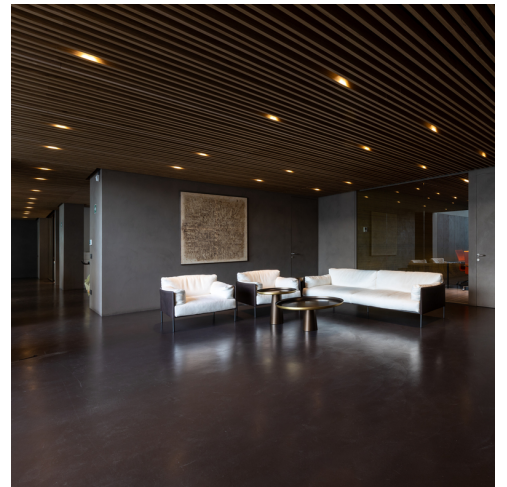
Sharp - Carlotta de Bevilacqua