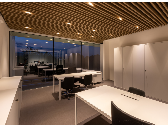
Sharp - Carlotta de Bevilacqua