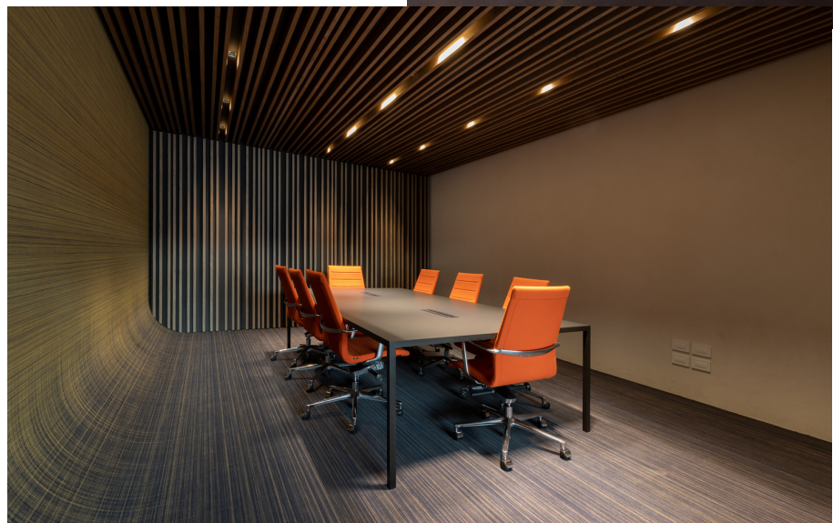
Sharp - Carlotta de Bevilacqua