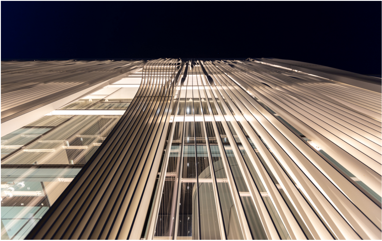
Spike - Studio Artemide