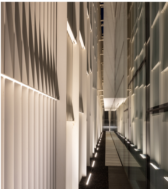
Spike - Studio Artemide

Artemide ha recentemente illuminato il nuovo headquarters di Faeda a Montorso Vicentino. Per questo progetto, sono stati utilizzati Sharp incasso e il Sistema A.Sharpping per uffici e corridoi, e Spike per la facciata. Il sistema Sharp garantisce un'alta uniformità di illuminamento e un pieno controllo dell'emissione luminosa, mentre Spike, con le sue sorgenti LED ad alto rendimento, illumina la facciata creando giochi di luce grazie alla struttura in frange metalliche. Grazie a queste soluzioni avanzate, Artemide ha creato un ambiente di lavoro funzionale ed estetico che rispetta i valori e l'innovazione di Faeda.