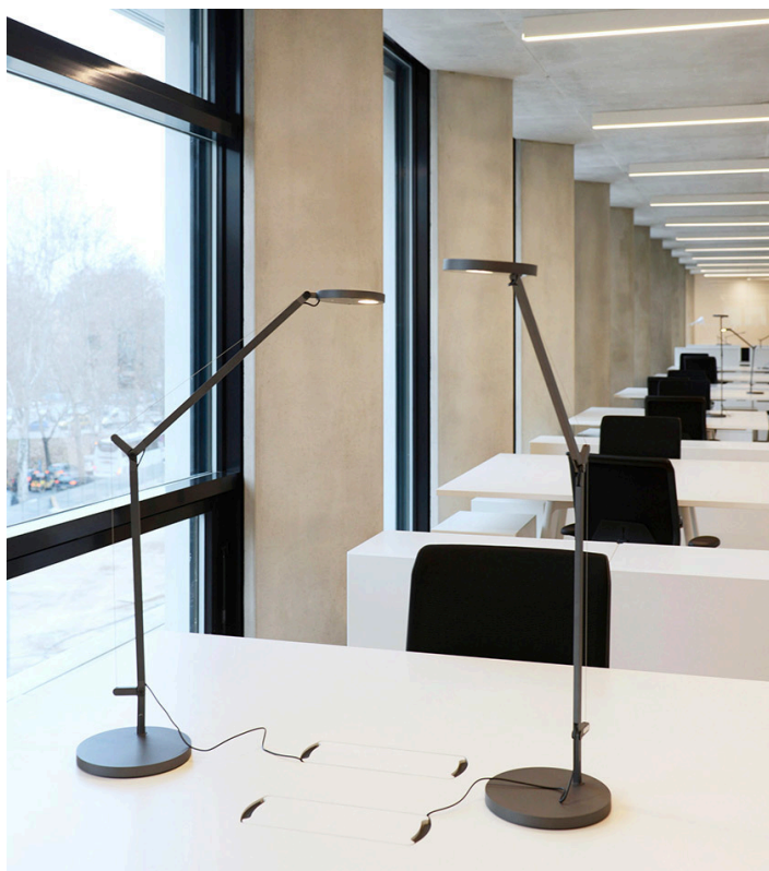
Demetra - Naoto Fukasawa

Negli ambienti degli uffici del terzo e quarto piano il sistema Algoritmo, integrandosi all'architettura, definisce un'illuminazione uniforme perfetta per gli spazi di lavoro dove ogni postazione è supportata anche dalle task light Demetra tavolo.