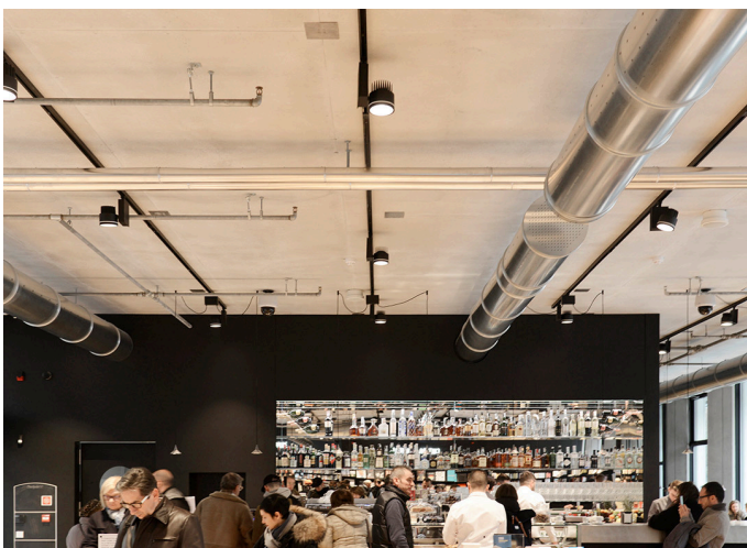
Picto 125 High Flux - Studio Artemide