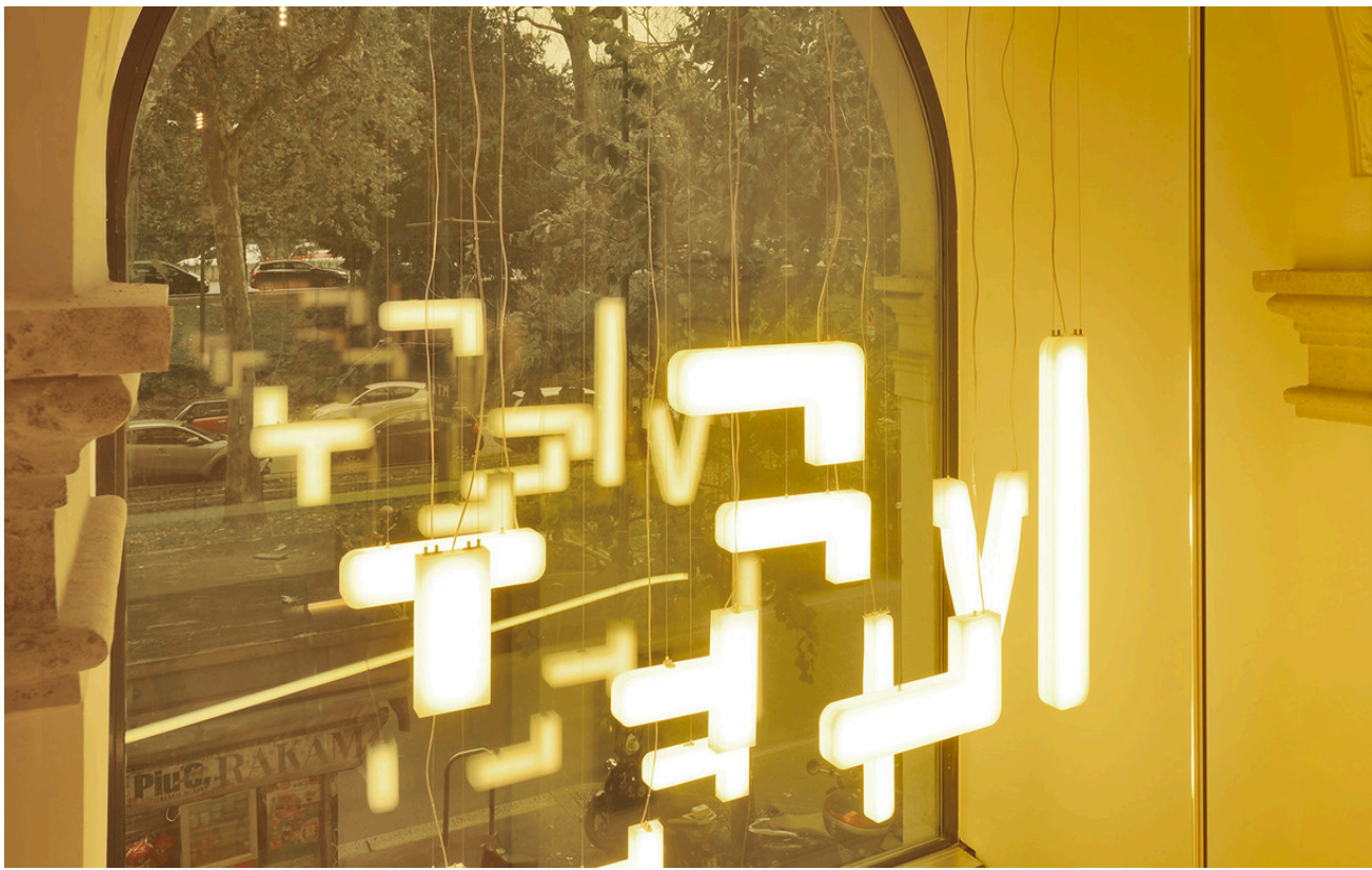
Chandelier custom by Artemide & Carlo Ratti