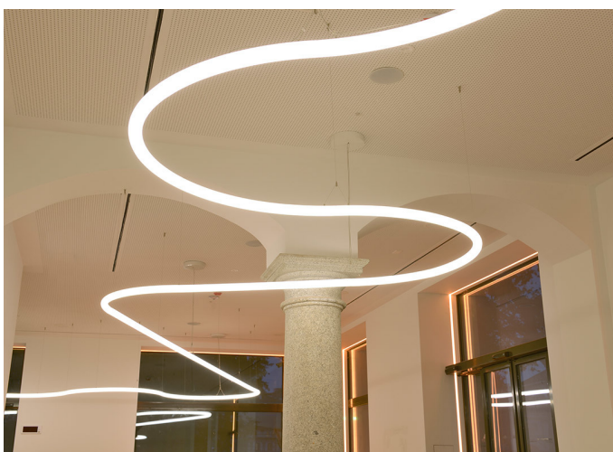
Alphabet of Light System - BIG