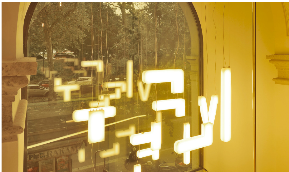
Chandelier custom by Artemide & Carlo Ratti