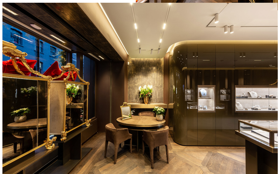
A.24 System + Vector Magnetic | Sharp Recessed - Carlotta de Bevilacqua