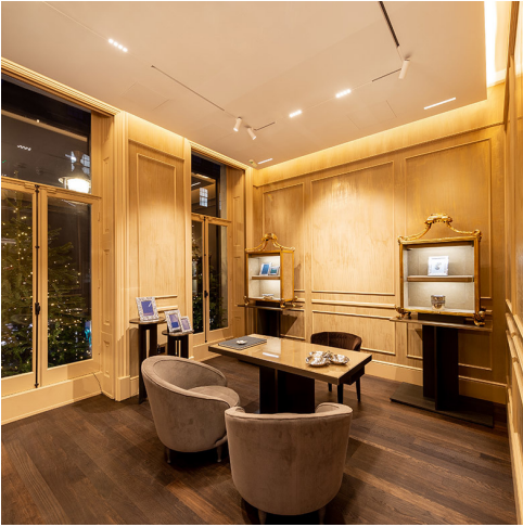
A.24 Magnetic + Vector Spot - Carlotta de Bevilacqua