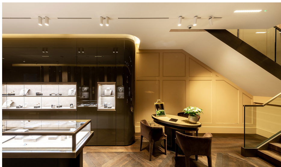
A.24 System + Vector Magnetic | Sharp Recessed - Carlotta de Bevilacqua