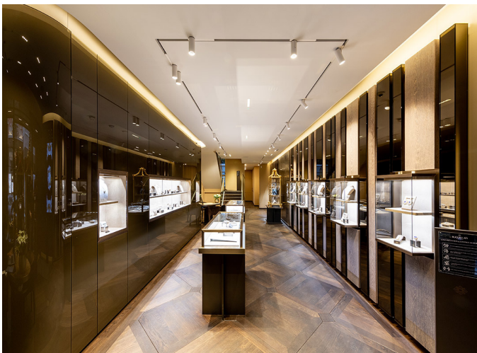
A.24 System + Vector Magnetic - Carlotta de Bevilacqua

Artemide illumina la boutique di Londra con A.24 System , una piattaforma aperta in grado di gestire molteplici strumenti di illuminazione per realizzare una perfetta integrazione nello spazio, e inoltre permette al progettista di applicare la corretta tipologia e dose di luce dove opportuno.