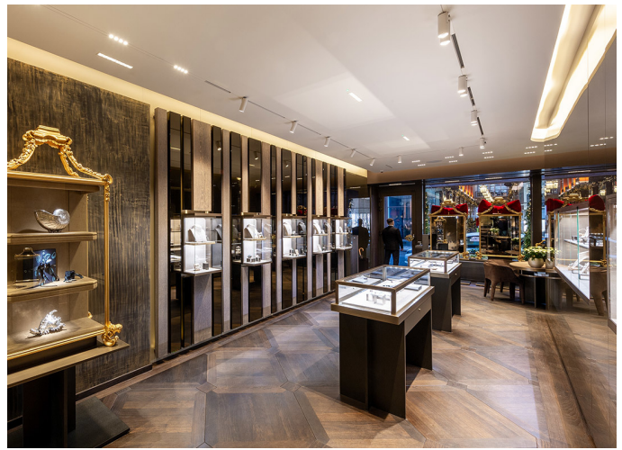
A.24 System + Vector Magnetic - Carlotta de Bevilacqua