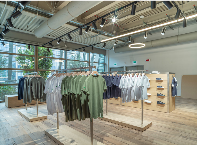
AoL - BIG | Vector Track - Carlotta de Bevilacqua