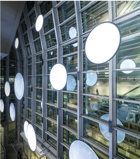
Discovery Vertical RGBW - Ernesto Gismondi

Un cluster di 28 Discovery , appositamente realizzate anche nella dimensione custom di 190cm, accoglie il visitatore nello spazio a tutta altezza che collega i cinque piani di Green Pea.