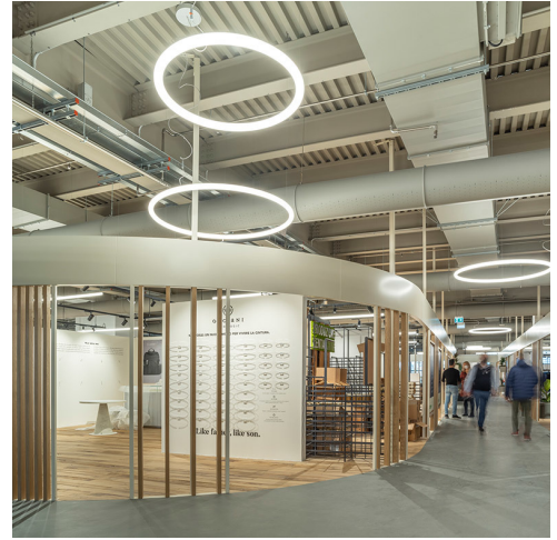
AoL Circular - BIG