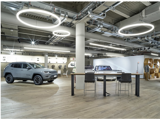
AoL Circular, AoL Linear - BIG