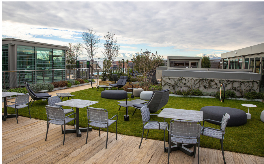
"O" - Elemental

La superficie trasparente prende vita con una luce bianca o colorata, verde in onore di Green Pea, per una soluzione scenografica, che si intravede anche dall'esterno attraverso la facciata.