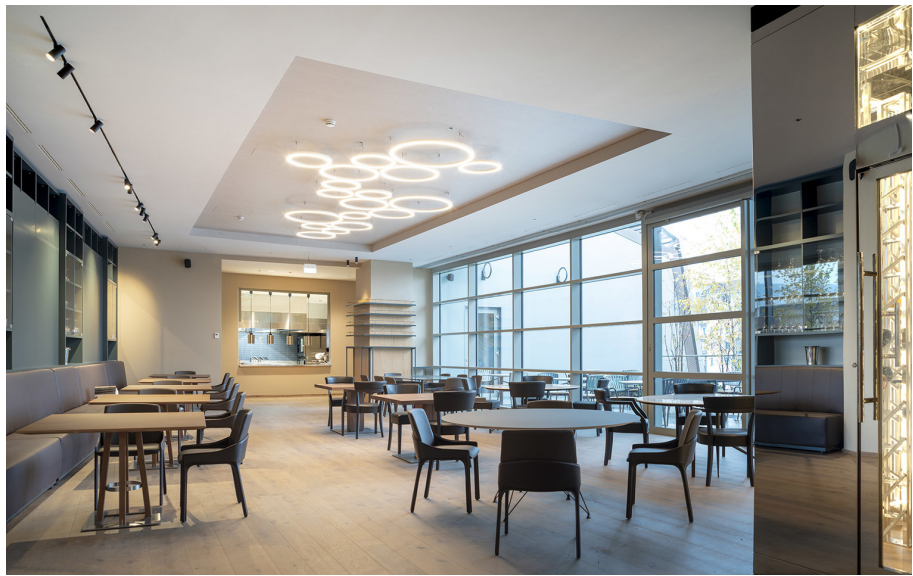
Ripple - BIG | Vector 95 - Carlotta de Bevilacqua