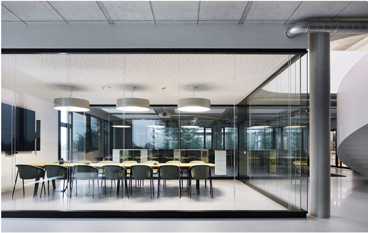
Tagora 970 Sospensione - S./R. Cornelissen