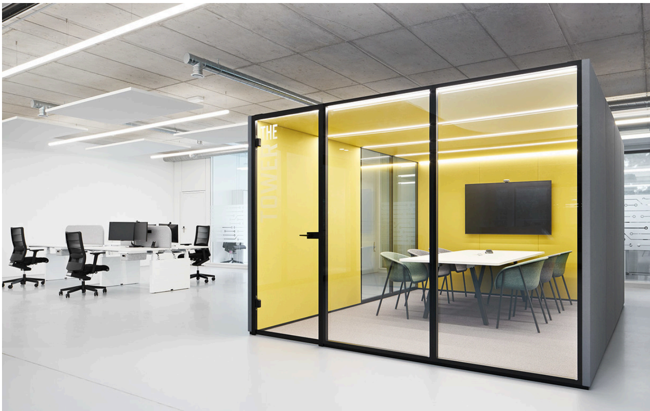
Alphabet of Light System - BIG

CML Europe, leader di mercato nei circuiti stampati per le industrie automobilistiche, ha costruito una nuova sede a Palmbach, vicino a Karlsruhe. L'obiettivo del progetto illuminotecnico era quello di riflettere il DNA dell'azienda in sintonia con l'architettura generale. I circuiti stampati potevano essere idealmente riprodotti con il sistema Alphabet of Light che allo stesso tempo si adatta perfettamente all'architettura innovativa.