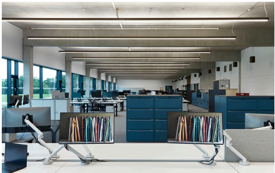
A.39 Diffused - Carlotta de Bevilacqua