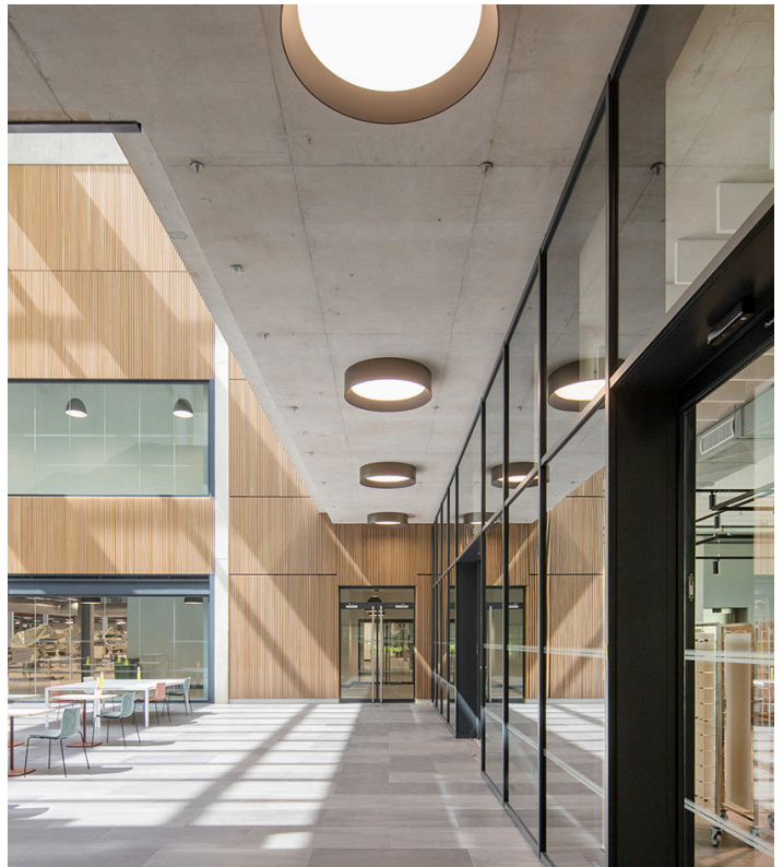
Tagora 970 Soffitto - S./R. Cornelissen

Artemide ha lavorato con Simon Siegel, fondatore di Atomic Interiors, per creare un concetto di illuminazione che completasse e migliorasse l'architettura e l'esperienza umana dell'edificio.