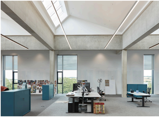
A.39 Diffused - Carlotta de Bevilacqua