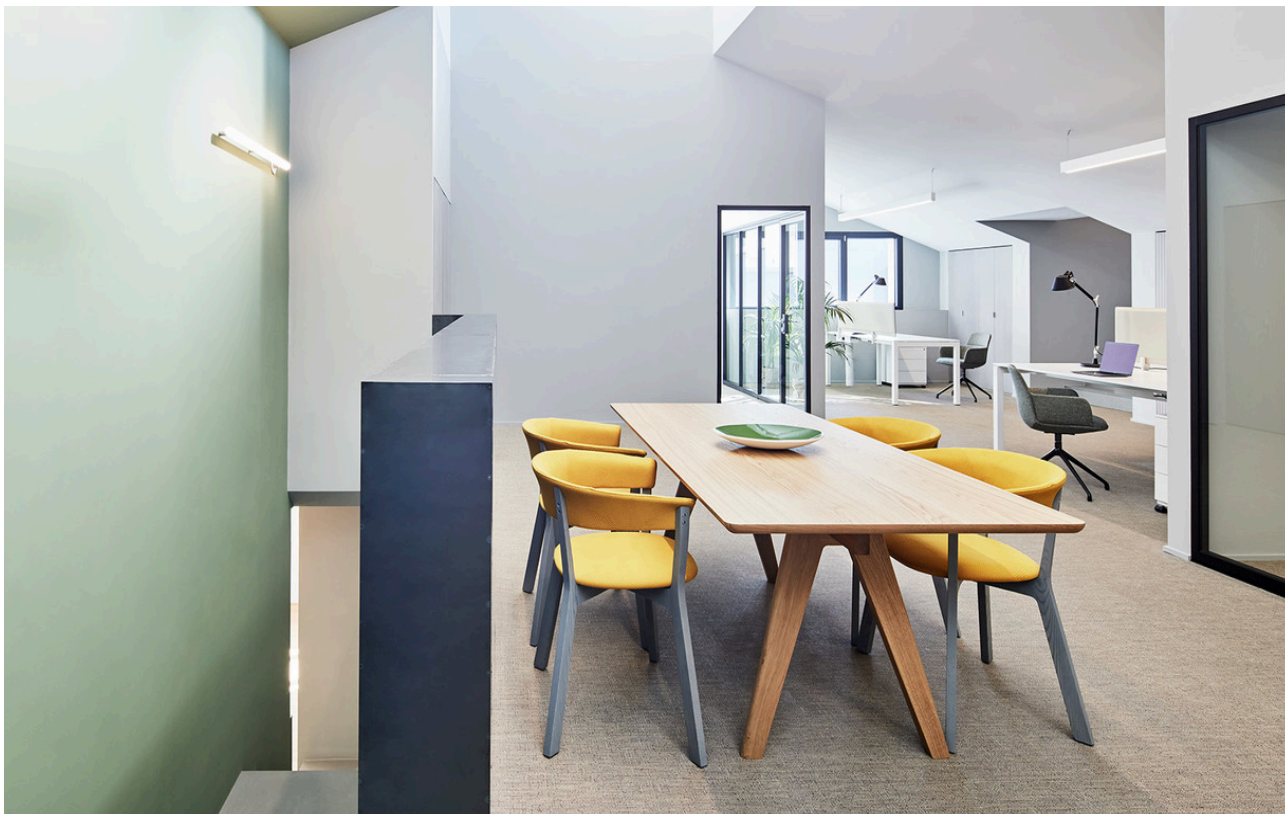
AoL Linear Wall - BIG | Tolimeo - Michele De Lucchi & Giancarlo Fassina | A.39 - Carlotta de Bevilacqua

Per la selezione dei prodotti d'interni utilizzati nel progetto, sono state individuate aziende italiane attente alla promozione dell'etica del lavoro e alla capacità di preservare e valorizzare il saper fare e il Made in Italy. Proprio in ragione di questa filosofia progettuale lo studio Bertero Projects ha scelto Artemide per l'intera illuminazione degli spazi. La filosofia "The Human and Responsible Light", competenza e innovazione ma anche espressione di ricerca e grande qualità del manufacturing sono alla base della lunga collaborazione con lo studio.