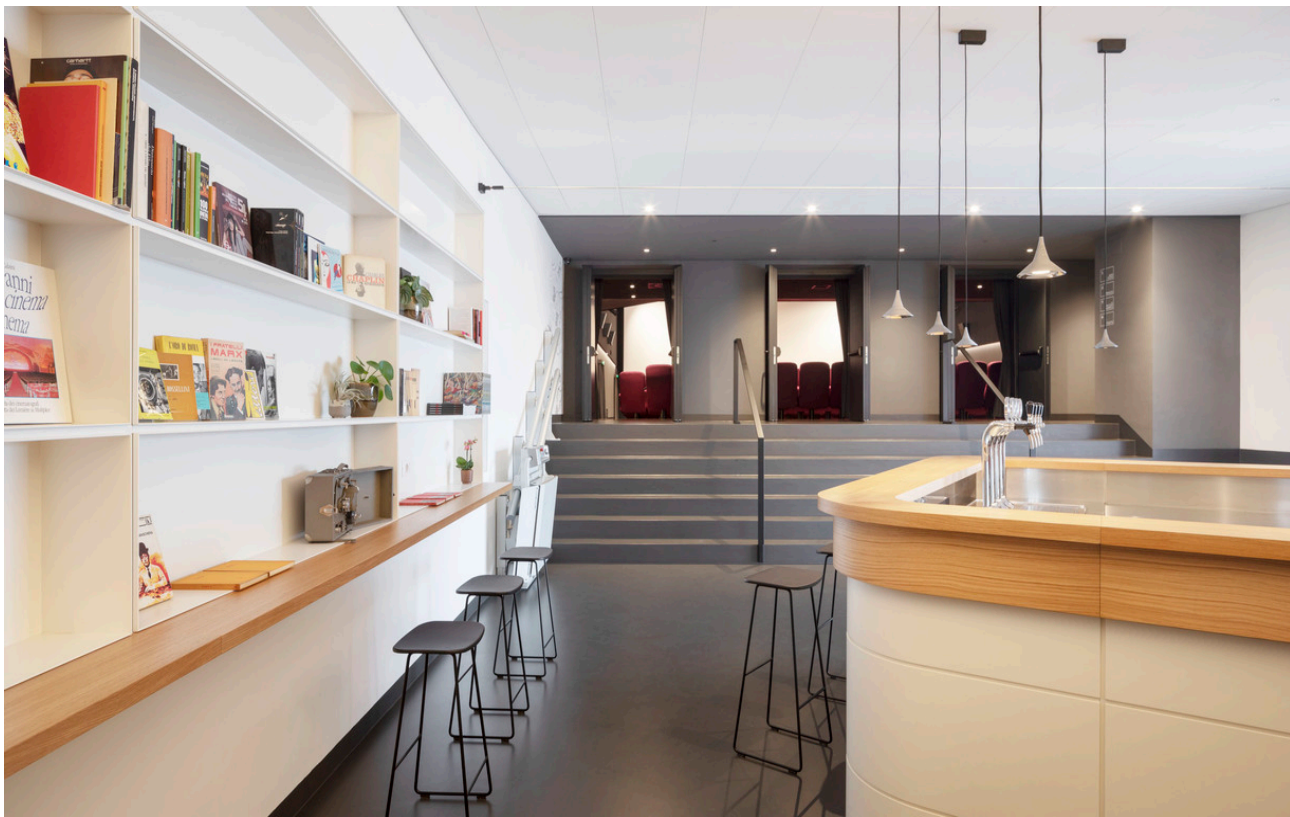
Unterlinden - Herzog & de Meuron

L'intero progetto è stato oggetto di un elaborato lavoro di restauro che gli architetti hanno portato avanti in dialogo costante con la Committenza e con la supervisione della Soprintendenza Speciale Archeologia Belle Arti e Paesaggio di Roma.