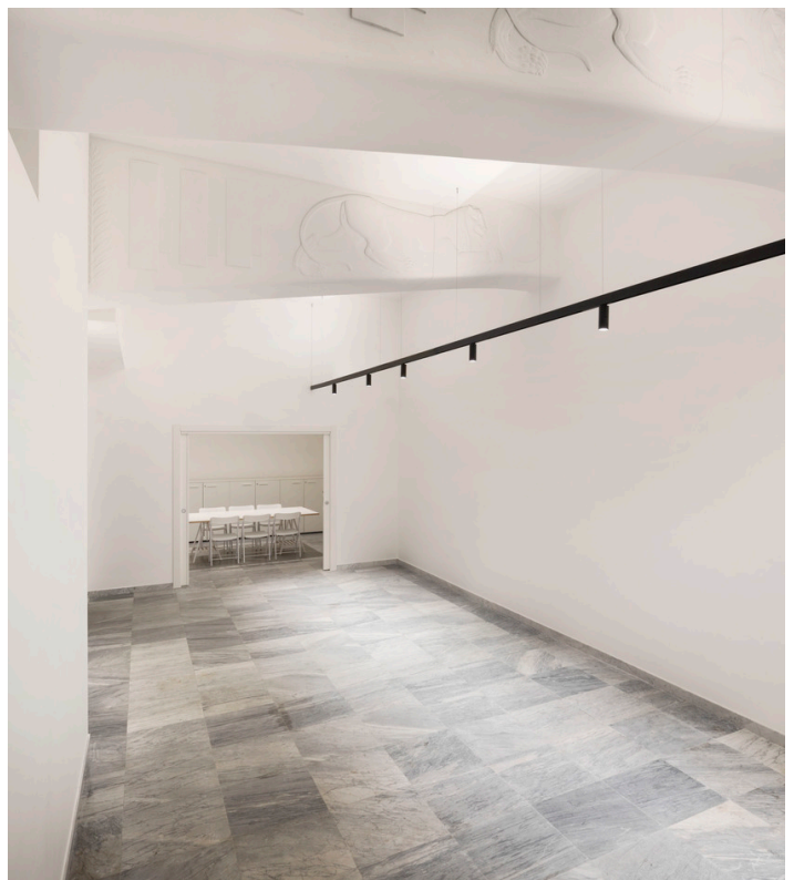
A.24 System + Vector Magnetic - Carlotta de Bevilacqua

Un'opera di restauro e risanamento conservativo che, basandosi su una ricca documentazione di archivio e su sondaggi sulla materia dell'opera, ha cercato di restituire al cinema i suoi caratteri originali.