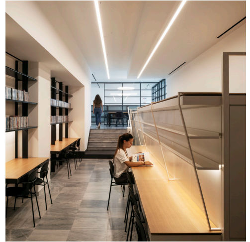
A.39 Diffused - Carlotta de Bevilacqua